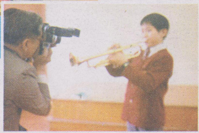
▶初次代表協和參加校際音樂節便贏得冠軍，果然是音樂神童。