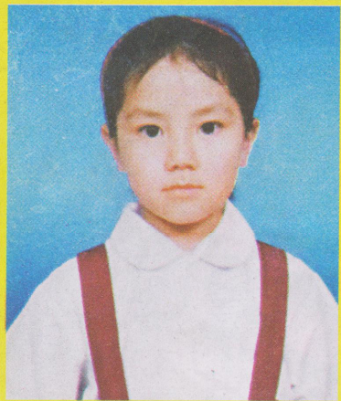
▲▼二年級的 G.E.M. (上) 和四年級的 G.E.M. (下)，圓瞳的一雙眼最易認。

自小愛唱歌的 G.E.M.，小學時代也有參加學校合唱團，因為有天分，還經常給老師選中擔任獨唱部分，可見年紀小小的她已漸露鋒芒。「協和是給我信心的地方，多得老師當年給我機會，才讓我一路上唱歌這條路。」