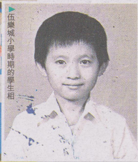
▶伍樂城小學時期的學生相