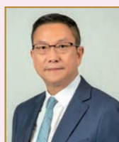
全國政協常委 北京市政協常委 港區召集人 施榮懷

尊敬的李家超行政長官，林銳副會長，何靖副主任，楊晉柏部長，孫青野副署長，方建明副特派員，各位嘉賓、各位理事： 大家好！歡迎各位蒞臨今天的慶典。首先，由衷的對長期支持本會發展的香港中聯辦、京港兩地政府及各有關方面表示衷心的感謝！對本會同仁辛勤付出表示衷心的感謝！ 回望來路，初心未泯，2015年在中央政府駐港聯絡辦公室、北京市委、北京市政協等機構的大力支持下，香港北京交流協會成立。八年中，我們攜手前行，堅守「一國」之本，善用「兩制」之利；八年中，我們收穫滿滿，創新會務發展，爭取人心回歸，營造和諧社區，贏得港京兩地社會各界的充分肯定和高度讚譽；八年中，我們上下