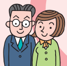
インターネットに関連した事業者