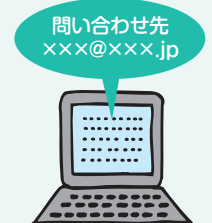
問い合わせ窓口の整備