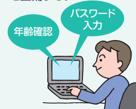
有害情報の閲覧防止の措置