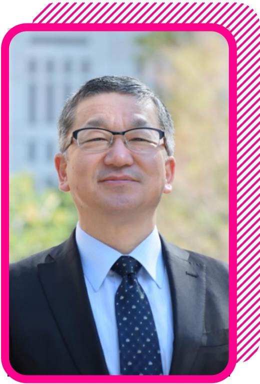
代表取締役社長 (最幸支援責任者)