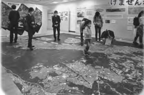
↑昨年地図展(神戸)のようす

今年7月2日に撮影した空中写真を床に敷きつめました。その上を歩いて、のぞきこんで、ご自分の家を見つけてみませんか。