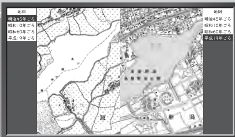
↑新潟市時層地図 (画面イメージですので実際のものとは異なります)

55インチ大型タッチディスプレイにタッチすると、見たい場所、見たい時代の地図や空中写真がパッと現れます。