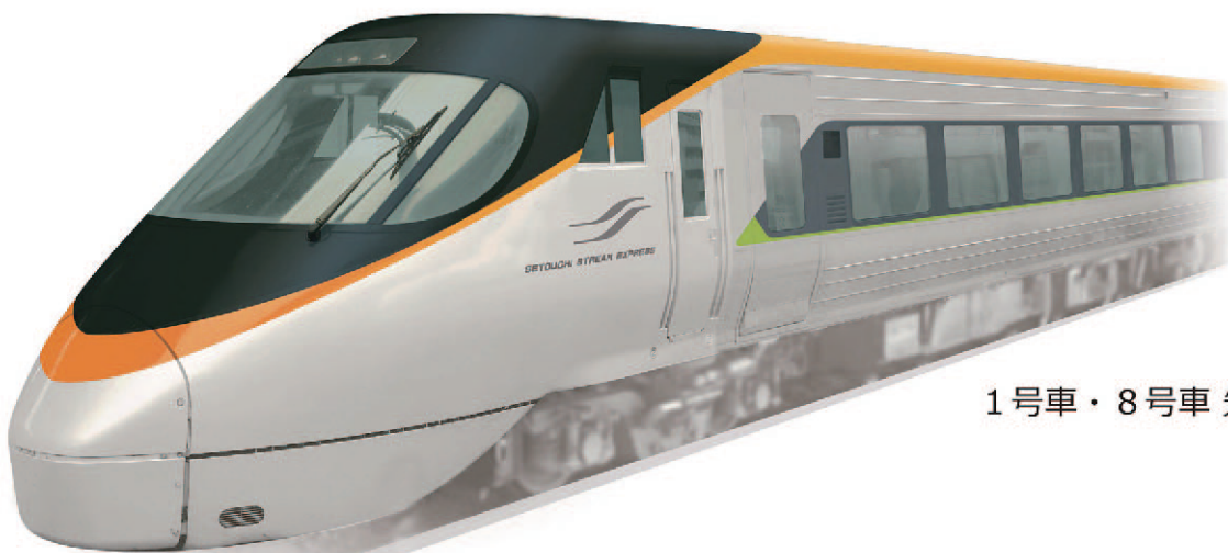
1号車・8号車 先頭イメージ

また、車両コンセプト「瀬戸の疾風」を進化させたエクステリアデザインとし、より特急らしいスピード感やスマートさを感じて頂ける列車へとリニューアルいたします。