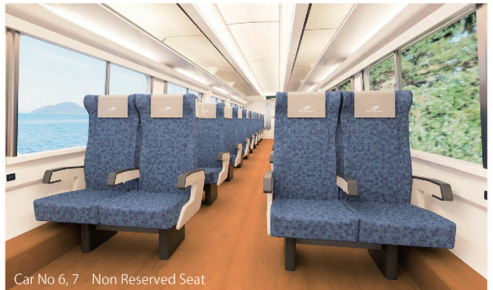
Car No 6, 7 Non Reserved Seat