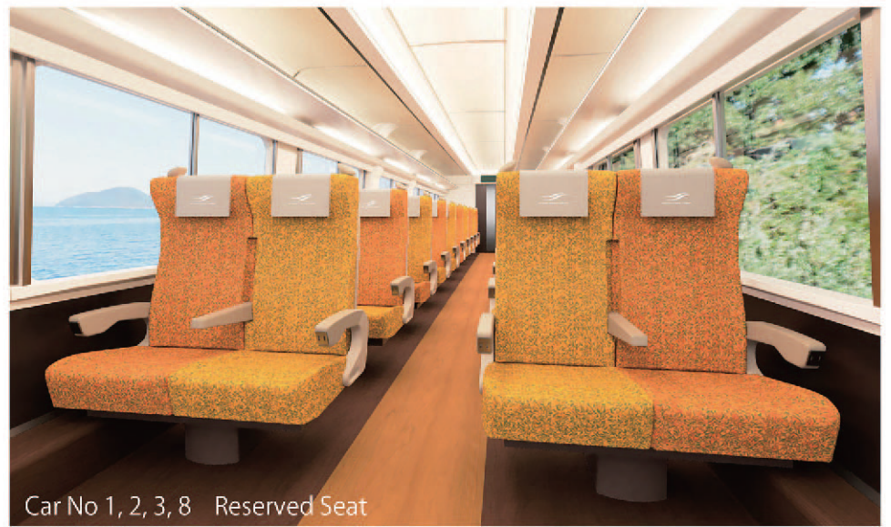
Car No 1, 2, 3, 8 Reserved Seat