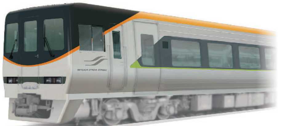
5号車・6号車 先頭イメージ