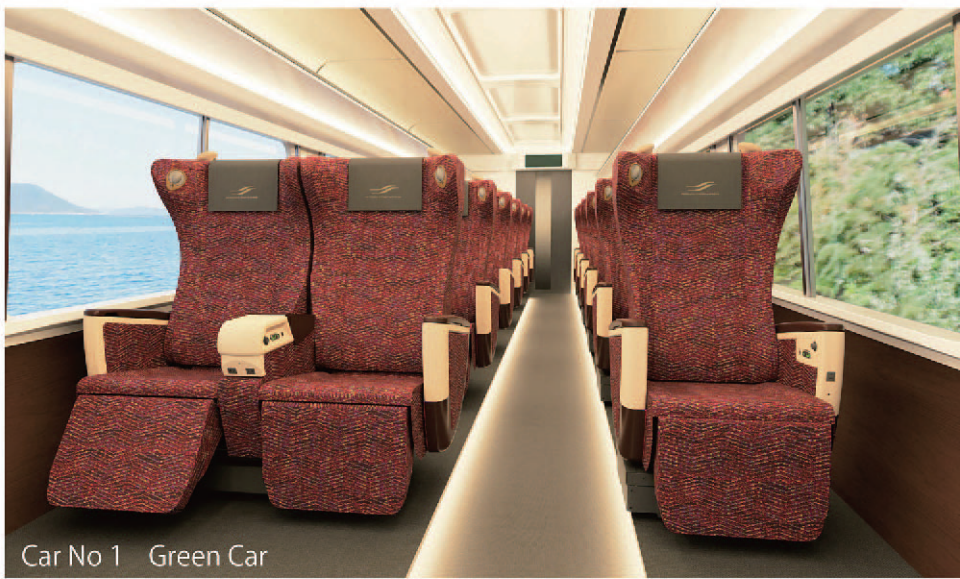
Car No 1 Green Car