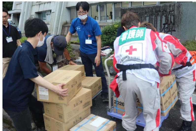
「救援物資を配布する救護班 (鳥取県鳥取市)」