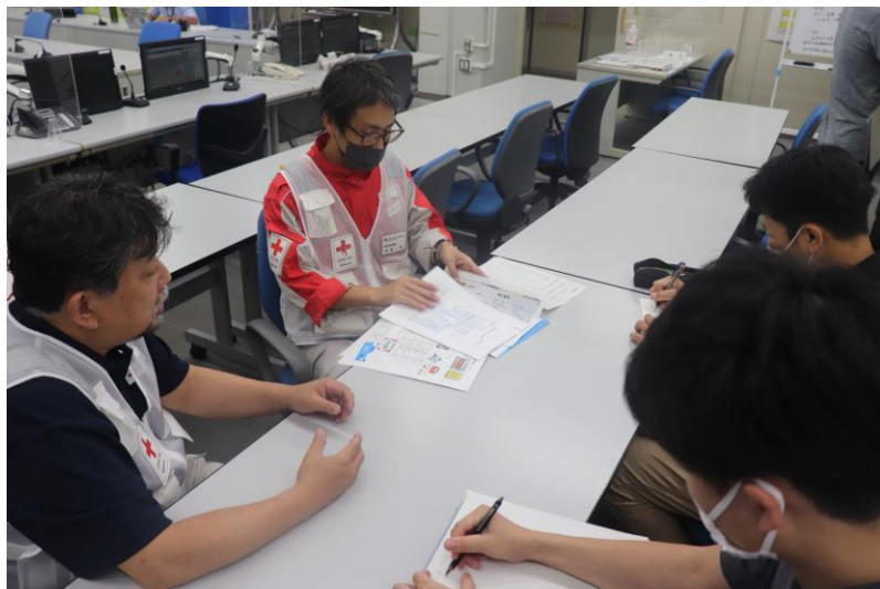
「県庁で情報収集を行う日赤災害医療 コーディネーターチーム(鳥取県鳥取市)」