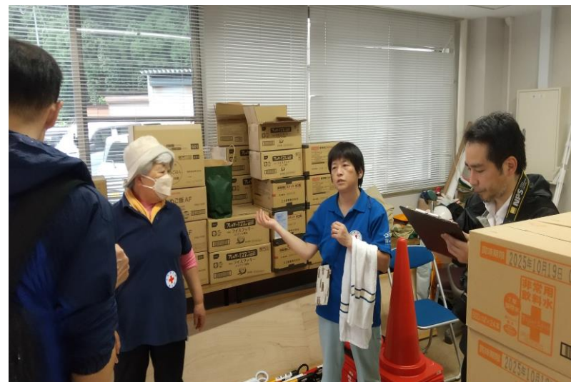
「避難所で非常食及び救援物資を配布する赤十字ボランティア（鳥取県鳥取市）」