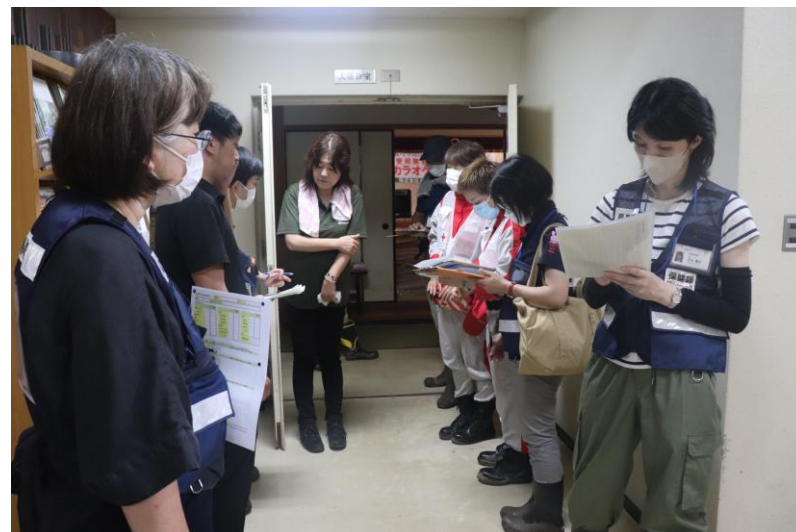
「関係機関とともに避難所を巡回する 救護班(鳥取県鳥取市)」