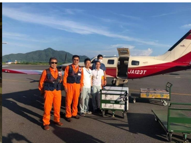
水やバナナを運ぶ赤十字飛行隊熊本支隊