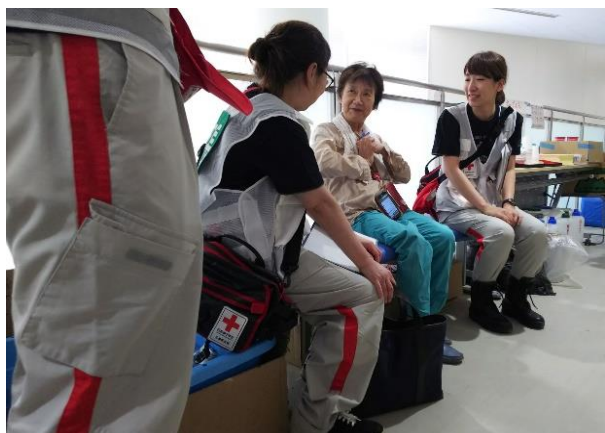
広島県の天応まちづくりセンターで活動する 広島県支部こころのケア班