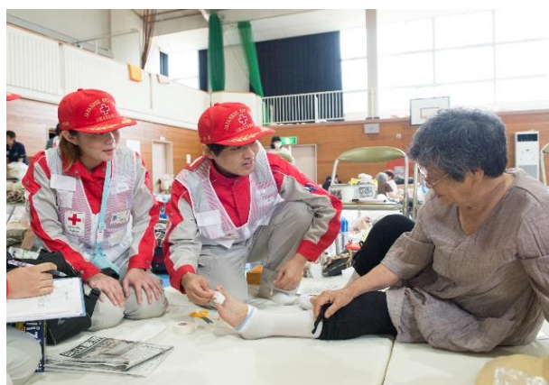
岡山県岡田小学校の避難所で活動している 岡山赤十字病院救護班