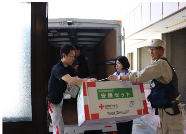
広島県支部より避難所へ救援物資を搬送