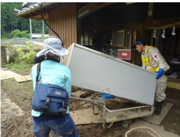
家財道具を運び出す三重県の赤十字奉仕団

現在は、赤十字奉仕団による、安全・衛生管理の注意喚起、炊き出し、ボランティアセンターでの業務支援活動等を行っております。