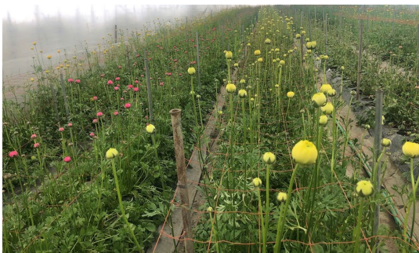
桂農場で生産されたランタンキュラス