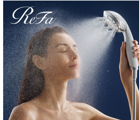
ReFa FINE BUBBLE PURE

※1部屋各1アイテムずつをご用意しております。(※シャンプー&トリートメント各10mlパウチ人数分)