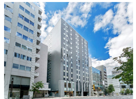
JRイン札幌北2条外観

JR北海道ホテルズ株式会社が経営・運営する宿泊特化型ホテルである「JRイン札幌北2条」は、JR札幌駅から徒歩7分、地下鉄大通駅から徒歩6分と観光・ビジネスの拠点となる好立地と「すべては心地よい目覚めのために」というJRインのブランドコンセプトを体現する空間により、お客様に快適な旅のひとときを提供いたします。