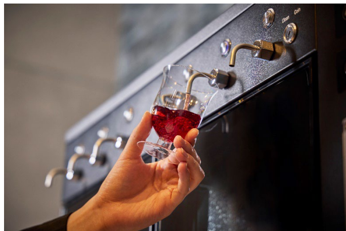
サーバー利用のイメージ

これまでホテル日航ノースランド帯広では、地元食材を取り上げた各種イベントや、朝食メニューリニューアルなど十勝の魅力を発信してまいりました。このたび、新たにセルフ式スタンディングバーを設け、さらなる付加価値あるホテルステイを提供してまいります。今後も JR 北海道ホテルズ株式会社では、人々の交流の場であるホテルを通じて常に新たな価値を創造し、地域社会の発展貢献を目指してまいります。