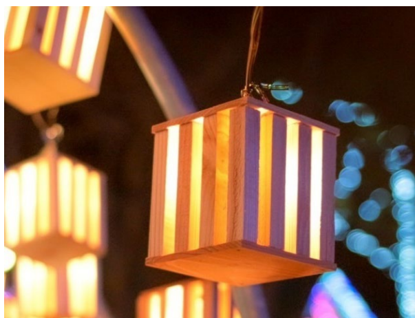
広尾町『サンタランド・ウッド』のウッドランタン