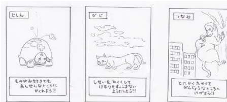
図3 どうぶつ防災ぬりえ (参考作品選出)