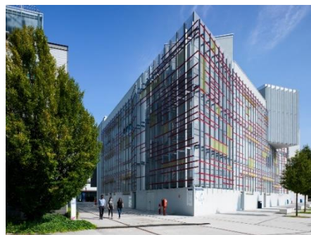
スタイリッシュな ミラノ工科大学のキャンパス