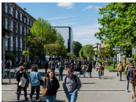
海外出身者でにぎわう ブリュッセル自由大学のキャンパス

ミラノ工科大学（学長：ドナテッラ・シュート）は、1863年に設立されたイタリア有数の国立大学で、とくに工学やデザイン、建築分野で国際的に高い評価を受けています。QS世界大学ランキング2024年版においてイタリアで第1位、世界で111位の大学です。分野別ではアート&デザイン、建築学/建築環境で共に世界7位を誇ります。ミラノ市内外に7つのキャンパスを持ち、世界中から学生や研究者が多く集まることも特徴です。