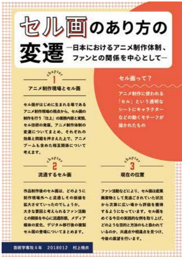
村上桃衣 「セル画のあり方の変遷-日本におけるアニメ制作体制、ファンとの関係を中心として-」