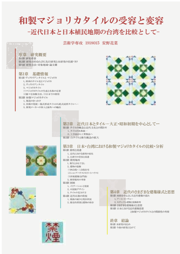
安野花菜 「和製マジョリカタイルの受容と変容-近代日本と日本植民地期の台湾を比較として-」