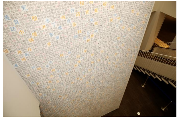
漢字ミュージアムに展示中の「漢字5万字タワー」

その「漢字5万字タワー」から、一部分を切り取って筆ペンでなぞれるようにしました。いろいろな漢字、あなたはいくつ知っているでしょうか。