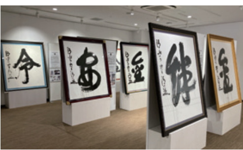
▲歴代29枚の大書を展示 (画像は過去の企画展の様子)

「今年の漢字」開催初年の1995年から2023年までの大書を展示します。本物が持つ迫力と、一連の展示が表す日本の世相の移り変わりをお楽しみください。