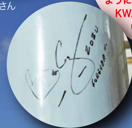
ブライアン・メイさん が残した45cm屈折 望遠鏡土台のサイン

2020年 1月27日、イギリスの伝説 的なロックバンド「クイーン」のギ タリストで宇宙物理学者のブライアン・ メイさんが花山天文台を見学され、以下の 応援メッセージを贈ってくださいました。 『花山天文台の存続への戦いを支援します。こど もたちが、このすばらしい歴史をもつ天文台を 訪れ、あこがれ、次世代の若いアマチュア天文 学者のインスピレーションの重要な源となる ように、花山天文台の存続を! (KEEP KWASAN ALIVE!)』 (ブライアン・メイさんのイン スタグラムより)