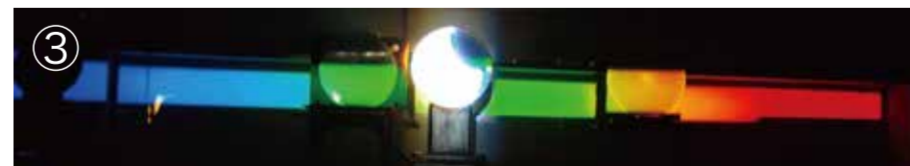
③太陽スペクトル（虹） 太陽館： 70cm シーロスタット望遠鏡