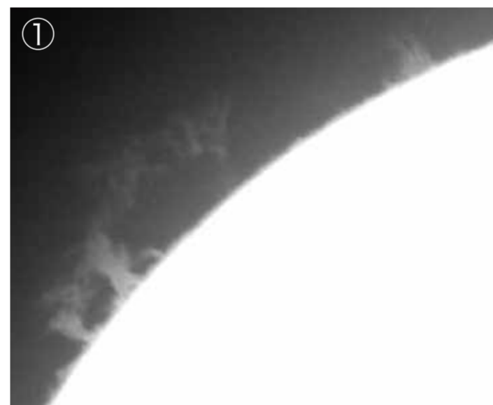
①太陽プロミネンス（2022年9月15日） ②中規模フレア（2021年11月2日） 別館：18cm屈折ザートリウス望遠鏡。晴天時には、リアルタイムの太陽画像を観察できます。