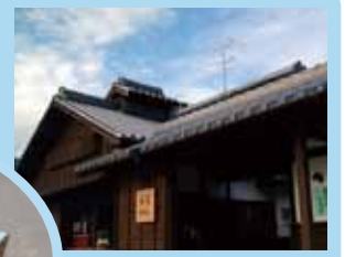
メイン会場の弁天サロン