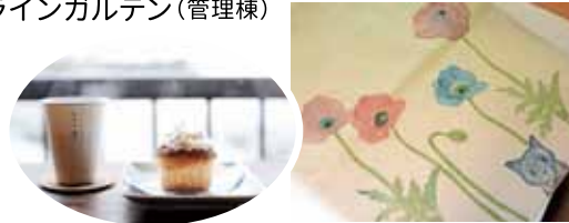
猫野べすかエコバック(参考)