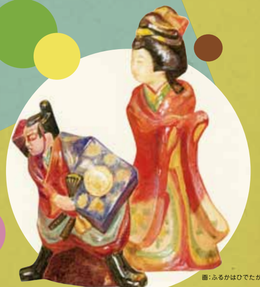
画：ふるかはひでたか

山田のや、ミヤチヤスヨ、増田光、 べくにょんす、掛江祐造、小池夏美、 濱比嘉詩子、高田谷将宏、 池谷幸子(おみくじ茶会)