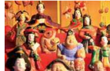
弁天サロンの土壁と土人形展示

「西尾市岩瀬文庫」は、明治期の西尾の実業家・岩瀬弥助が私財投じて収集した8万点に及ぶ近世から近代の幅広い分野の書物で構成される全国的に知られる図書館型博物館です。本展では、“食”をキーワードに岩瀬文庫所蔵で、明治期の和菓子デザイン集「菓子模様帖」、幕末の絵師・一英斎芳艶による江戸の名物店を紹介した、すごろく「新版御府内流行名物案内双六」、幕末京都に活躍した本草学者・山本章夫による「果品」から、ふるかはひでたかが着想を得た3作品(うち1作品は連作)を展示します。“西尾の食”を題材にした驚きの作品も登場。お見逃しなく！