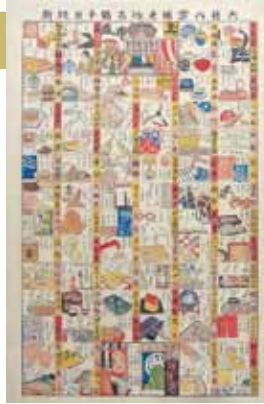
ふるかはひでたか「新版日本橋名物老舗案内雙六」

かつて雛まつりに佐久島で飾られていたのは手作りの素朴な土雛でした。女の子が産まれると、土雛が贈られたそうです。土雛は対岸の知多半島にある常滑などから行商が売りに来ていました。中には多産の象徴である犬、猫などの動物、長寿を願う翁と媪、さらに芝居の一場面を現したような様々な人形があり、それらも雛人形といっしょに飾られました。土雛をとりまくように飾られるのは華やかな吊し飾り。期間限定の素敵な撮影スポットをどうぞお楽しみください。