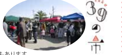
昨年開催された39の市の様子

佐久島の若者たちが企画する島マルシェ。佐久島からは「民宿の親父のたこめし・牡蠣めし」や漁師の浜焼き、旬のはっさく・伊予柑・わかめ・ひじきを始めカフェ等が出店。島外からも日本酒・みりん・味噌・酢や常滑焼などのクラフトのお店も続々と集合。きっとあなたの好きなものに出会えるはず。