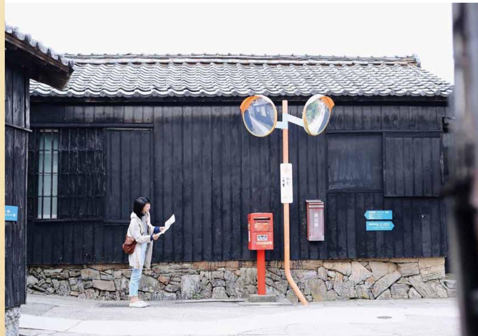
黒壁集落