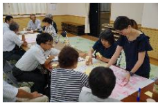
農村RMO形成に向けた取組