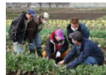
障害者等の農産物栽培技術の習得