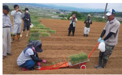
高収益作物の導入

収益力向上や販売力強化等に関する取組、複数の集落の機能を補完する農村RMOの形成、デジタル技術の導入・定着を推進する取組を支援します。