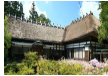
古民家等を活用した滞在型施設の整備