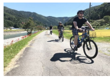
景観等を利用した高付加価値コンテンツの開発