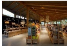
農林水産物加工・販売施設の整備