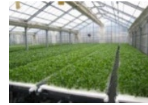
障害者等が作業に携わる生産施設の整備