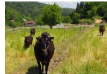
農地の粗放的利用