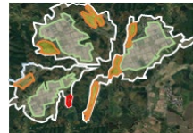
土地利用構想の作成