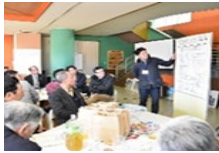
地域活性化のための活動計画づくり※