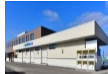
集出荷・貯蔵・加工施設の整備