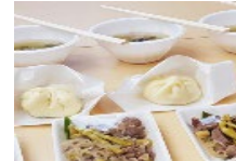
山菜を利用した商品開発