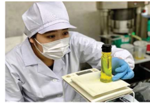
地域資源を活用した新商品開発