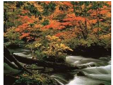
오이라세계류 단풍 (가을)