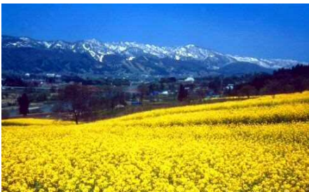
유채꽃 공원에서 치쿠마카와 전망