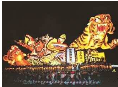
아오모리 네부타 마쓰리 (여름)