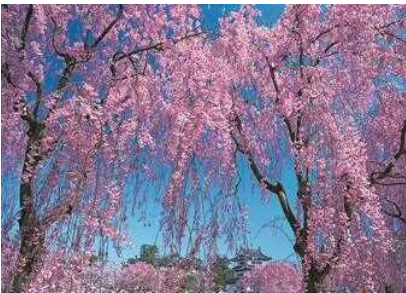
히로사키공원 사쿠라 (봄)