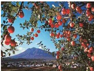
일본 최다 생산량 사과