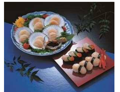
안전안심 맛있는 가리비조개