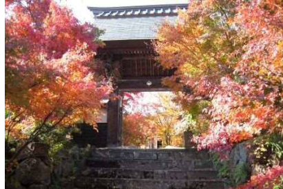
단풍에 물든 절