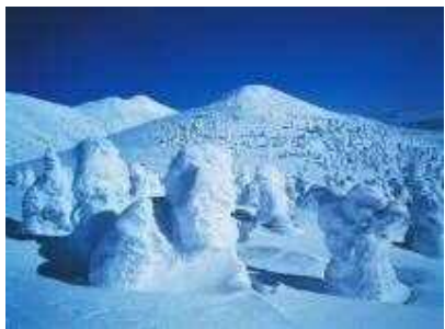
하코다산 수빙 (겨울)