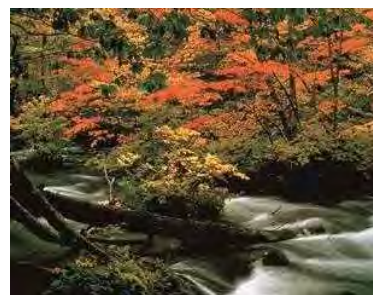
奥入濑溪流的红叶（秋）