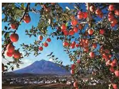
产量日本第一的苹果