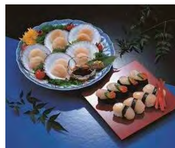
安全安心且美味的海贝