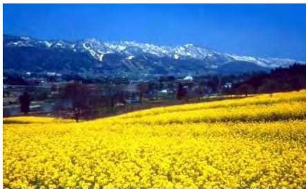
从油菜花公园远眺千曲川