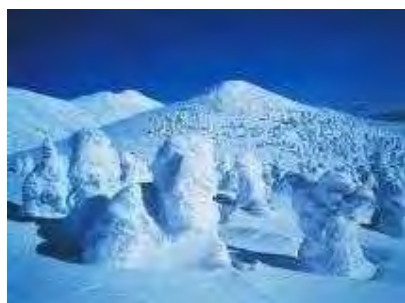
八甲田山的雾凇（冬）