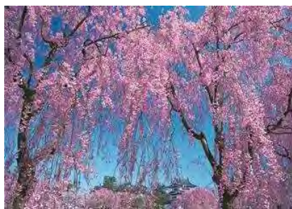
弘前城公园的樱花（春）