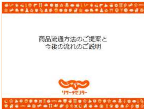
図表 事業者向け研修会における販売方法説明資料（抜粋）