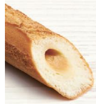
中央にメープルペースト入り

外はさっくり、中はふんわりとしたケーキ生地、メープルペーストを包み、香り高いシナモンシュガーをまぶしました。