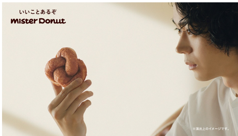
<新TVCM むぎゅっとドーナツ「パンのふり」篇より>

株式会社ダスキン（本社:大阪府吹田市、社長:山村 輝治）が運営するミスタードーナツは、新商品『むぎゅっとドーナツ』の新TVCMとして、俳優の菅田将暉さんを起用したむぎゅっとドーナツ「パンのふり」篇（15秒）を、2021年6月11日（金）から全国で放映開始します。