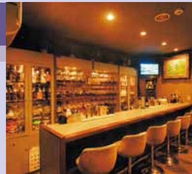
大人数の貸し切りパーティにも対応してくれます

北九州市門司区栄町5-21 ベイサイドコア1F ◎18:30~24:00 日・祝日定休 席数:20席 お客様を楽しませてくれる、気 さくなママの人柄が人気。店内は 落ち着いた雰囲気、リラックス できます。門司港の夜のひととき をゆったり満喫するには最適。