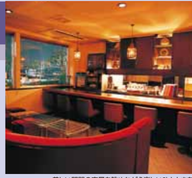
美しい関門の夜景を眺めながら楽しいひとときを

B スナック&パブ TON・TON ☎093-331-7701 【MAP: A-4】