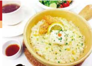
(ランチセット)ふく白子の焼きリゾット...1,800円+税

19 マリーナテラス KAITO ☎093-322-3366 【MAP: A-6】 北九州市門司区西海岸1-3-3 関門海峡ミュージアム5F ◎11:00~15:00(0.S 14:00) 17:00~21:30 (0.S 20:30) 変更の可能性あり 不定休 席数: 約90席 ②ミュージアム駐車場2000円毎に2時間まで無料