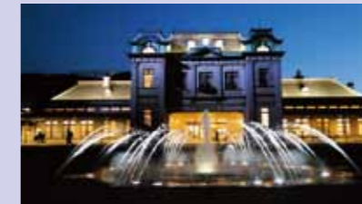
昼とは、また違った表情の門司港駅