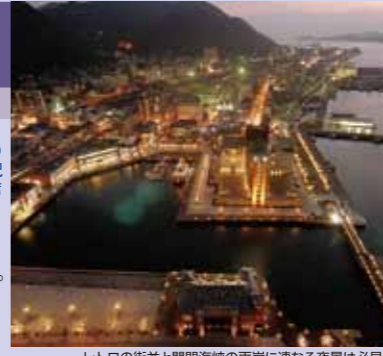
レトロの街並と関門海峡の両岸に連なる夜景は必見

A 展望カフェ AIR'S CAFÉ ☎093-321-4151 【MAP: B-2】