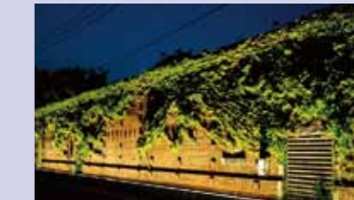
門司港レトロ駐車場の赤レンガ壁