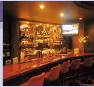
男女を問わず、幅広い年齢層の人が楽しめるカラオケスポット

北九州市門司区栄町5-19 第二小原ビル1F ◎20:00~1:00 水曜定休 席数:17席 初めてのお客様も気持ちよく歌え て楽しめる評判の、明るいママ が迎える居心地の良いお店。 カラオケチケット1,100円で、 15曲楽しめるのも嬉しい。