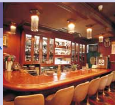
ママ自作の素敵な器で、もてなしてくれます

北九州市門司区栄町11-6(NSプラザ1F) ◎17:00~24:00 日・祝日定休 席数:18席 日替りの家庭料理も人気があり、 これをお目当てでやって来る女性 客も多いとか。親子二代にわたっ て訪れるお客様や、家族連れにも 安心して飲めると評判のお店。