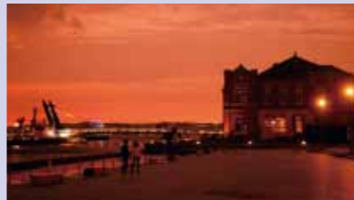
夕陽に包まれた親水広場周辺