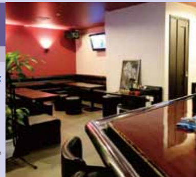
カラオケ音響、抜群です

C concert BAR ステラ ☎093-332-2611 【MAP: C-2】