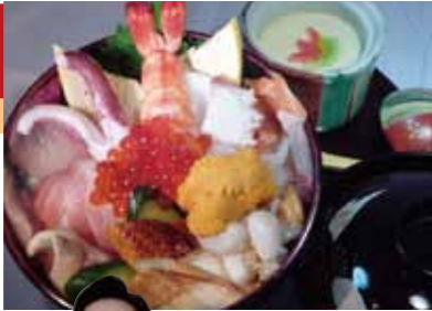
特海鮮丼セット(昼限定).....1,680円+税

15 寿し処 光本 (みつもと) ☎093-321-8377 【MAP: A-4】 北九州市門司区港町9-2 門司駅前ビル1F ◎11:30~14:00 17:00~ 月曜定休(祝日は営業) 席数:30席 ②無し