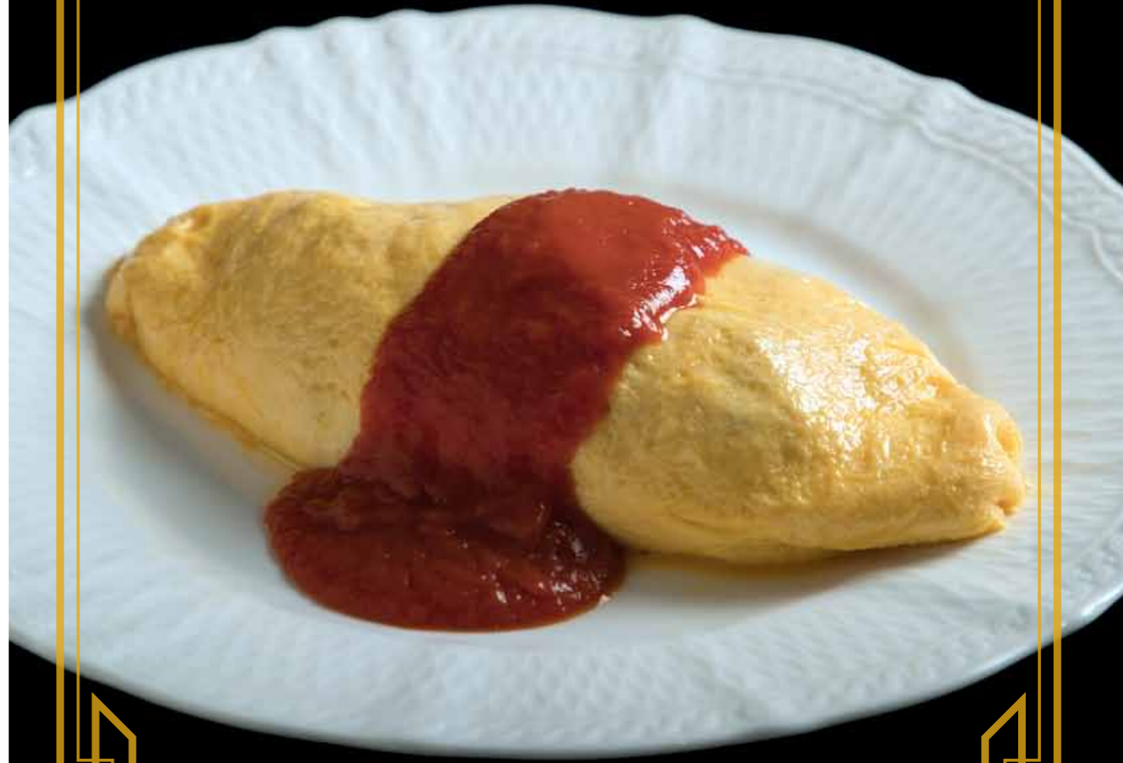
撮影協力/みかど食堂 by NARISAWA

レトロの街「門司港」の美味しいお食事処からお土産まで おすすめのお店をご紹介します