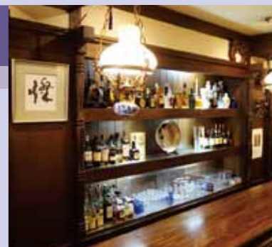
レトロな街にふさわしい、味のある落ち着いた雰囲気

北九州市門司区栄町10-3 席数:24席 ◎18:00~23:30 土・日・祝日定休(土・予約可) 女性3代が引き継ぐ門司港の老 舗バー。遠くで汽笛の音が響くな か、おいしいお酒と洒落た会話で、 ひとときの「心の休息」をお楽し みいただけます。