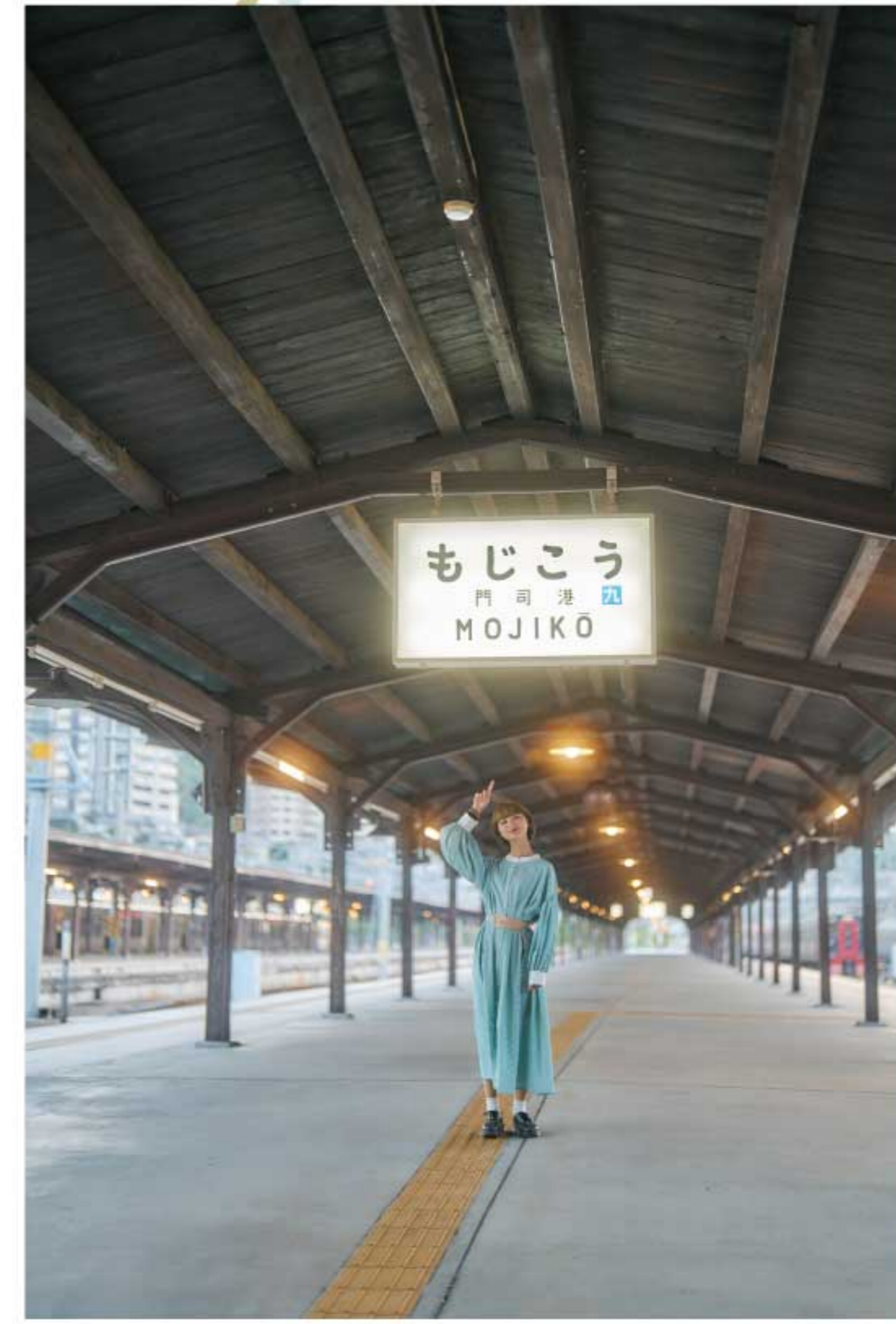
MOJIKO-STATION. KANMON KAIKYO. JINDO. YUKEI.YAKEI.YAKI CURRY.

訪れる人々に特別な体験を提供し、普遍的な魅力を未来に伝える門司港レトロは、その歴史と現代が融合した魅力的な観光地として、多くの人々に愛され続けています。