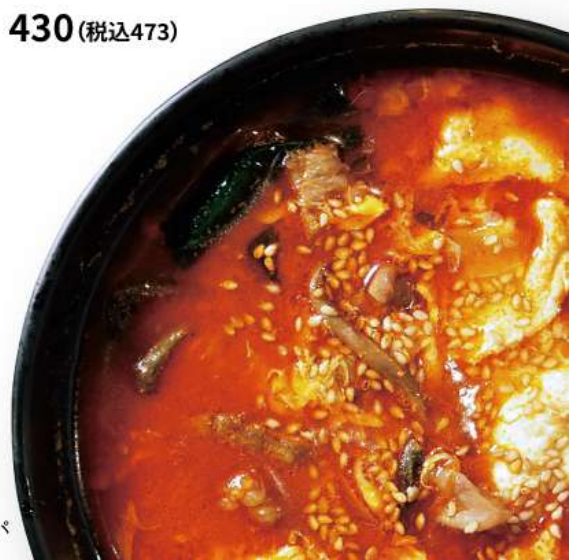
ユッケジャンクッパ