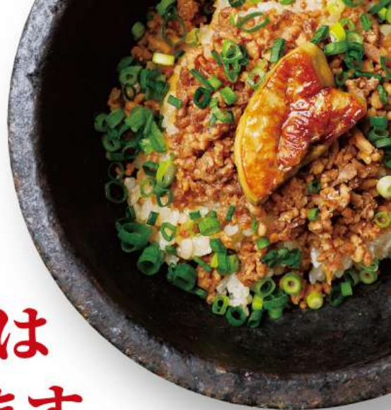
石焼フォアグラ・ビビンバ