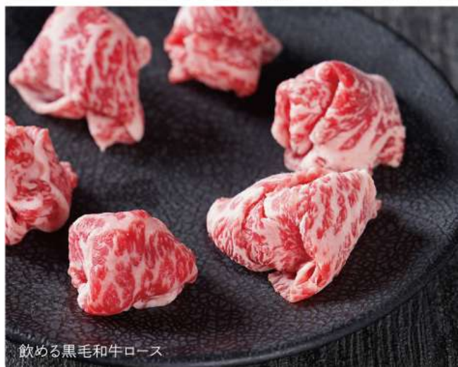
飲める黒毛和牛ロース