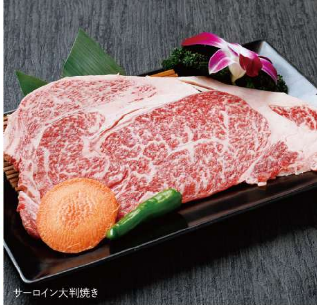
サーロイン大判焼き