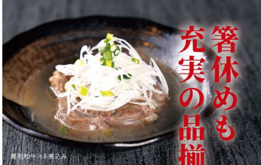
黒毛和牛スネ煮込み