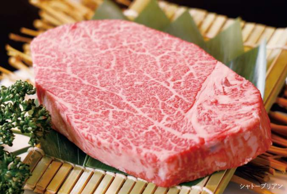
シャトーブリアン