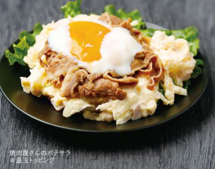
焼肉屋さんのポテサラ ※温玉トッピング