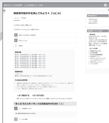
ライブWeb授業システムの画面イメージ

ライブWeb授業専用の【学習管理システム (LMS)】にアクセスして受講します。出席登録から、Zoom授業、レポート提出まで、学習のすべて※2が専用システム上で完結します。