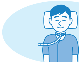
気管カニューレの交換