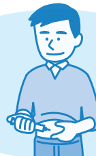
インスリンの投与量の調整