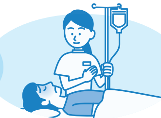
脱水症状に対する輸液による補正