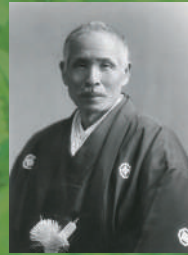
廣池千九郎 (慶応2年～昭和13年) Chikuro Hiroike (1866[Keio 2]～1938[Showa 13])

学者、教育者そして、救済活動家・社会啓蒙家として歩んできた創立者である廣池千九郎は、日本人のアイデンティティを求める過程で、人間としてどう生きるべきか、社会はどうあるべきかといった本質的な問題を追求し始めます。それが、道徳科学（モラロジー）という学問を生み出しました。