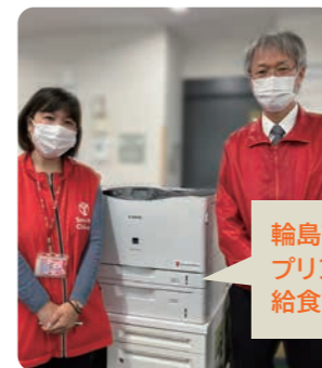
輪島市の小中学校にプリンターや給食簡易食器を支援