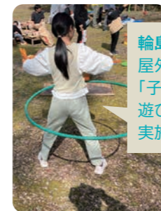
輪島市で屋外での「子どもの遊び場」を実施