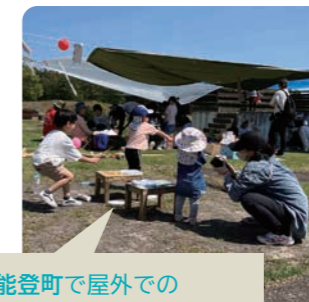
能登町で屋外での「子どもの遊び場」を実施