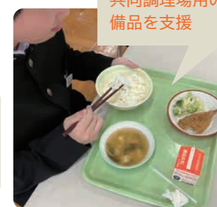
能登町で小中学校の共同調理場用の備品を支援