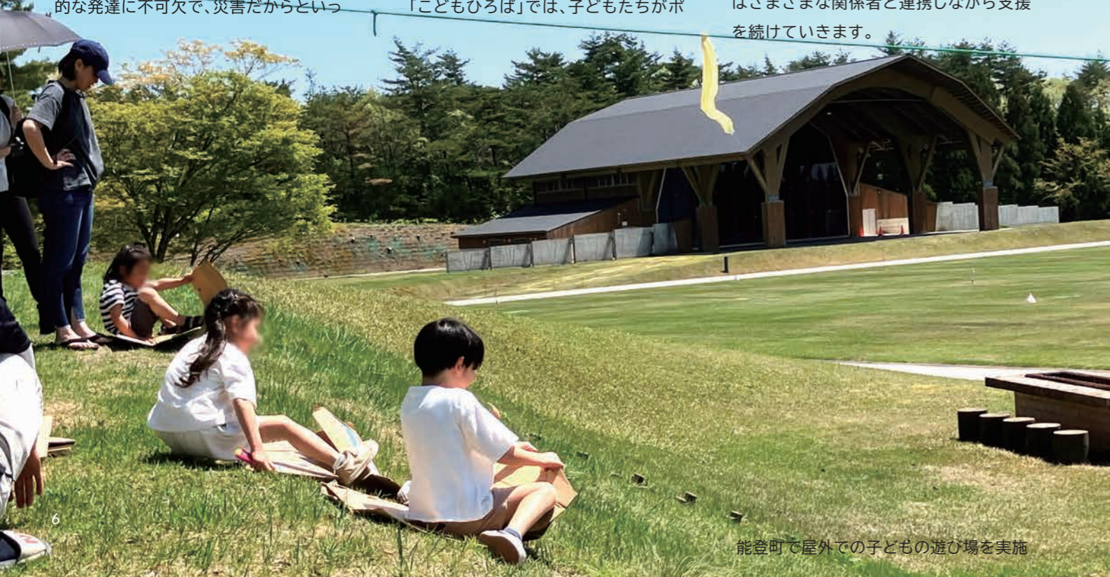
能登町で屋外での子どもの遊び場を実施

ロっと災害の体験を話したり、遊びの中で表現することもあります。そして、子どもたちが自然に感情を表現したり、共有していくことで、少しずつ災害のことを自分の中で整理したり、理解していき、こころの安定につながると言われています。子どもたちも大人と同じように、困難や逆境を乗り越える力を持っています。災害の影響を受けた子どもたちが自らの力を発揮し、少しずつ困難を乗り越えていけるよう、セーブ・ザ・チルドレンはさまざまな関係者と連携しながら支援を続けていきます。