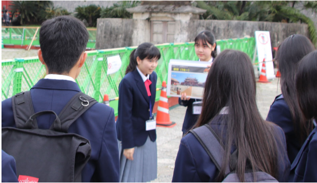
修学旅行生向けガイドの様様