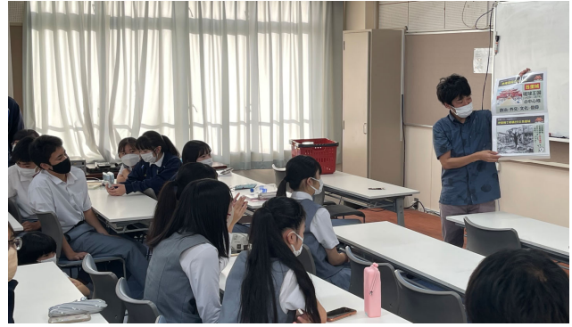
問題製作ディスカッションの様様

首里城復興、そして復興後も文化や遺産を守り、伝えていくには次世代の力が不可欠となります。 首里城復興AR謎解きラリーをきっかけに、今後も興南アクト部をはじめ、将来を担う次世代に参加いただける さまざまな取り組みを検討してまいります。