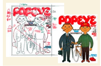
신타니 마사히로 <“POPEYE” 표지 레이아웃 원고> 2023년(재제작)과 “POPEYE” 1978년 6월 10일호 표지 ©매거진 하우스

디자이너 신타니 마사히로(시마네현 오키군 거주, 1943~)는 호리우치 세이이치(1932~1987)가 아트 디렉션을 맡은 혁신적 잡지 “anan”의 창간(1970)에 참여했으며, 이후 “POPEYE”, “BRUTUS”, “Olive”(모두 매거진 하우스에서 출간)의 아트 디렉터로 일했습니다. 에디토리얼 디자인의 매력을 소개하는 전람회입니다.