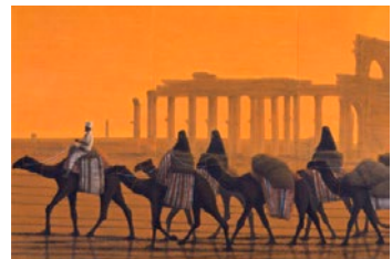
히라야마 이쿠오 <팔미라 유적을 가다·야침> 2006년 히라야마 이쿠오 실�크로드 미술관 소장

일본 화가로서의 활동에 국한하지 않은 히라야마 이쿠오의 다양한 업적을 아나나시현 호쿠토시에 위치한 히라야마 이쿠오 실�크로드 미술관의 소장품을 통해 소개합니다. 평화를 바라며 평생을 바친 히라야마의 마음을 미래로 잇는 전시회입니다.