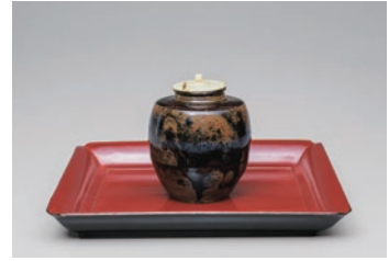
중요문화재 <중국 각진 어깨 차 용기 별명: 아부라야> 중국 남송~원 시대(13~14세기) 하타케야마 기념관 소장

주식회사 에바라제작소의 창업자이자 풍류를 즐겼던 하타케야마 잇세이(호: 소쿠오)는 오랫동안 미술품을 수집하여 하타케야마 기념관을 설립했습니다. 이 전시는 시설 개축 공사를 위해 휴관 중인 하타케야마 기념관의 컬렉션 가운데서 차노유, 린파의 명품과 더불어 마쓰다이라 후마이와 관련 있는 물건을 소개합니다. 주고쿠·시코쿠 지역에서 처음으로 개최되는 하타케야마 기념관의 전시회입니다.