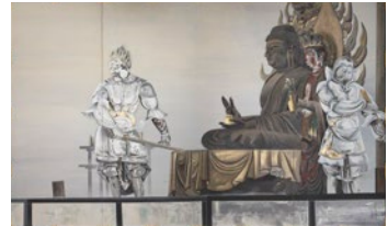
오치아이 로후 <화엄불> 1931년 가쿠후잔 진조지 절 소장

오치아이 로후(1896~1937)는 다이쇼 시대부터 쇼와 시대 초기에 걸쳐 활약한 일본 화가입니다. 1934년에는 메이로 미술연맹을 창설하여 ‘일본화’의 기성 개념에 파문을 일으키는 선구적 작품을 연이어 발표했습니다. 로후와 그의 동료들이 어떤 미래를 꿈꾸며 활동했는지, 그와 인연이 깊은 시마네에서 생각해 보겠습니다.