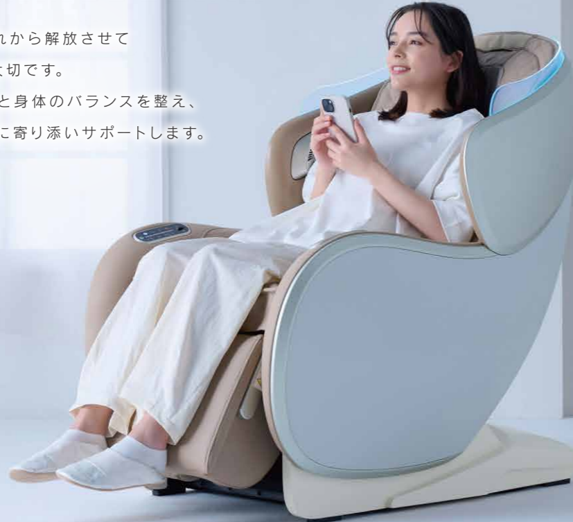
ゆったり寛げるリクライニングチェアモード マッサージを行わずに、ヒーター、Bluetooth®スピーカー、 リクライニング機能が使えるモードです。

忙しく変化する日々の中で、様々なストレスや疲れから解放させて 自分の心と身体のバランスを保つことがとても大切です。 CirC GRACEは心地よいリラクゼーションで心と身体のバランスを整え、 自分らしく、もっと毎日を楽しめるようにあなたに寄り添いサポートします。