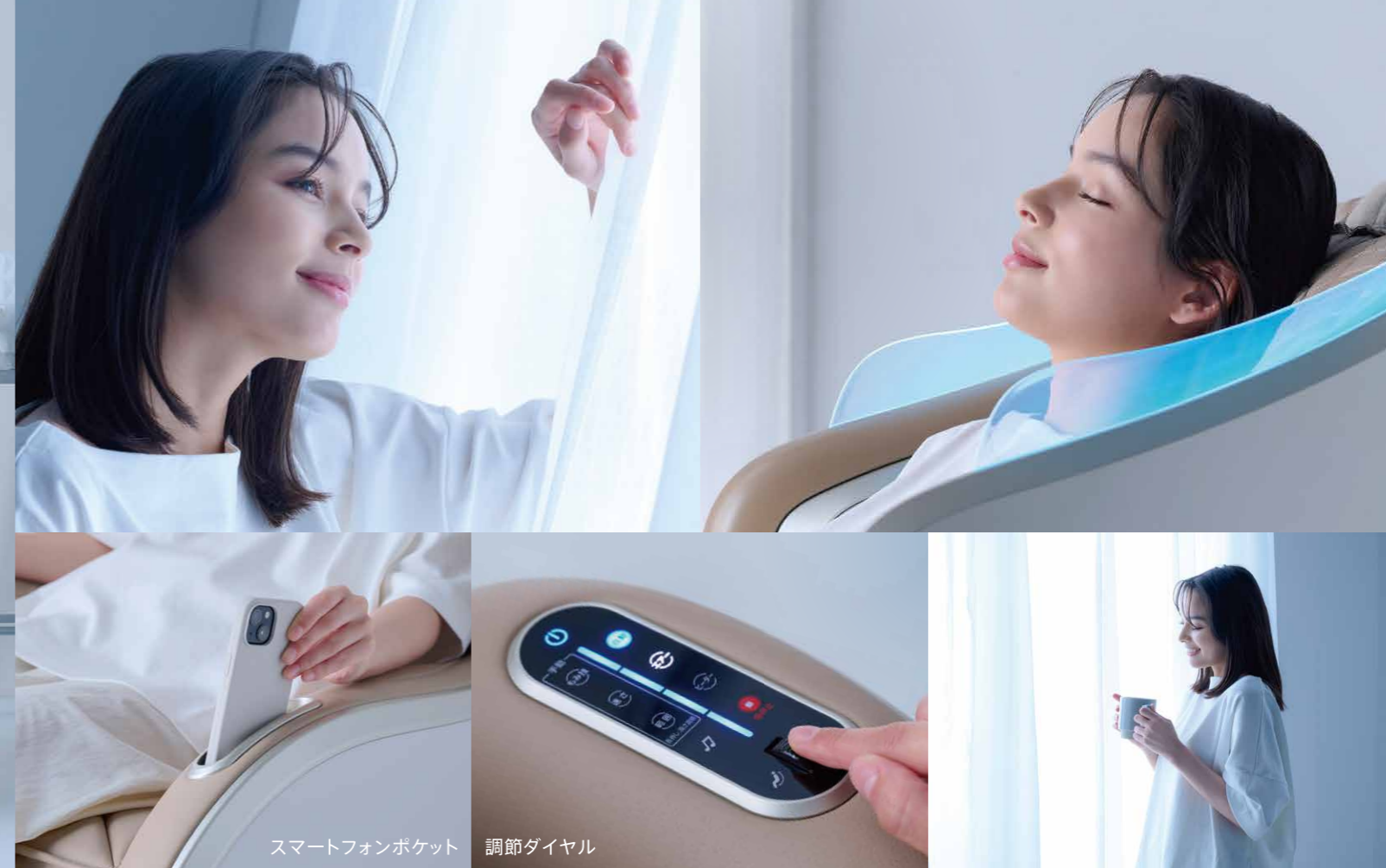
スマートフォンポケット 調節ダイヤル