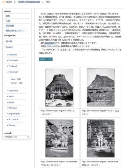
図4 尾高鮮之助調査撮影記録 一覧画面 http://www.tobunken.go.jp/materials/oplace1/バグー

表示されるようデザインした。また、公開当初のメニューは日本語のみだったが、2015年5月に英語メニューを追加した。英語メニューをWordPressに実装するには翻訳ファイルを用意する方法や、新たに英語名称での「カスタム分類」を作成する方法がある。これらはメンテナンス性が高く、データの追加や修正の多いデータベースには有益だが、本データベースはデータの追加を考慮する必要はないため、作業の簡便な従来のHTMLファイルの方式で実装した。したがって、日本語メニューは動的に生成されるが、英語メニューはHTMLファイルで作成された一覧が表示される。