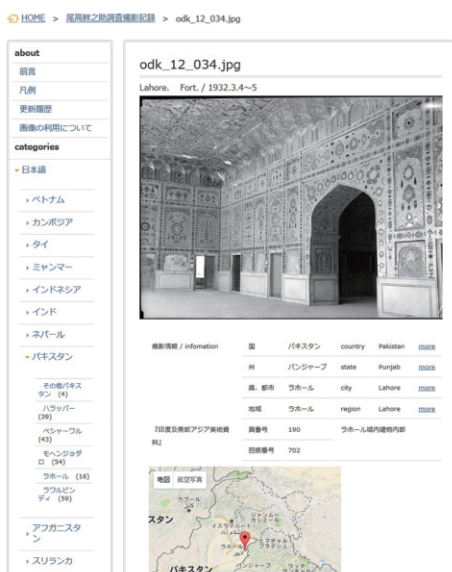
図3 尾高鮮之助調査撮影記録 個別画面 http://www.tobunken.go.jp/materials/odaka/26442.html

データベースを公開するウェブページの構成は、個々の画像とメタデータを表示する個別画面と、データベースを概観する全体画面の2つからなる。個別画面(図3)の構成は下記のとおりである。