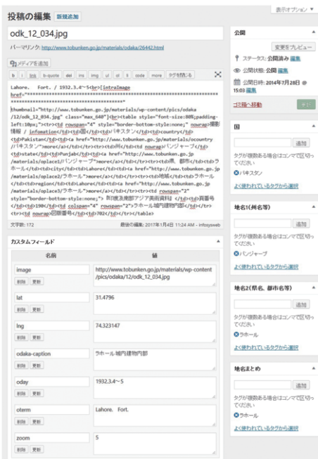
図2 尾高鮮之助調査撮影記録 管理画面

写真が撮影された場所の国名，行政区分（州名，県名・都市名），地域名およびその緯度・経度，WordPress上で撮影地点を示すのに利用したGoogleマップの表示倍率，画像ファイルを格納した場所のURL，『美術資料』所載キャプションである。なお撮影場所の地名表記については現在の表記に改め，漢字については常用漢字に置き換えた。また，国名，行政区分，および遺跡名はアルファベットによる表記を併記した。このような画像そのもののメタデータのほかに，WordPressの仕様上必須の情報として，後述の「カスタム投稿タイプ（custom post type）」で設定されたデータベースの名称，データの公開状態の情報を示す項目を追加し，個々のデータのタイトルとして画像ファイル名をこれにあてた。