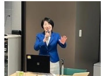
片倉氏による講演

・Involve 社「Heroes Women Role Model List」日本初の殿堂入り