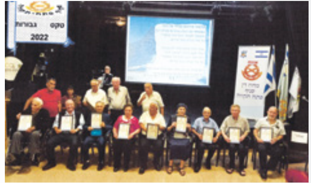
מאת: רמי יערי, סגן יו"ר הסניף וחברי הנהלת הסניף