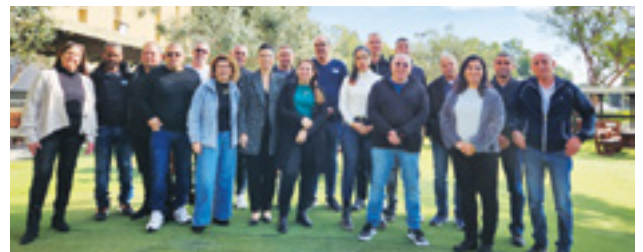
סדנת העצמה מחוז דרום

סל הכשרה לסיוע להשתלבות במעגל העבודה - באפשרותם של חברי "צוות" דורשי עבודה, המעוניינים לעבור הסבה מקצועית שתסייע להם להשתלב במעגל העבודה, לקבל סיוע כספי למימון ההכשרה מתוך תקציב סל הכשרה העומד לרשות יחידת התעסוקה. קבלת הסיוע מחייבת עמידה בקריטריונים. לקבלת פרטים נוספים ניתן לפנות למנהלי התעסוקה במחוזות.