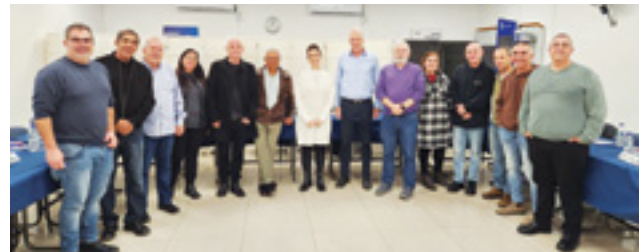
סדנת העצמה מחוז יהודה

קיימה סדנאות העצמה לחברים דורשי עבודה במחוזות בדצמבר 2022. מטרתן לפתח ולשפר את מיומנות השייך העצמי בתהליך חיפוש עבודה ולהעניק כלים לניצול הזדמנויות לתעסוקה. במסגרת הסדנאות, ניתנו הרצאות בנושא שכר והיבטים פנסיוניים. הנחיית הסדנאות בוצעה על-ידי מכון שיפור. ממשובי המשתתפים עולה, כי הסדנאות תרמו להם רבות והשיגו את מטרתן - השתלבות החברים במעגל העבודה.