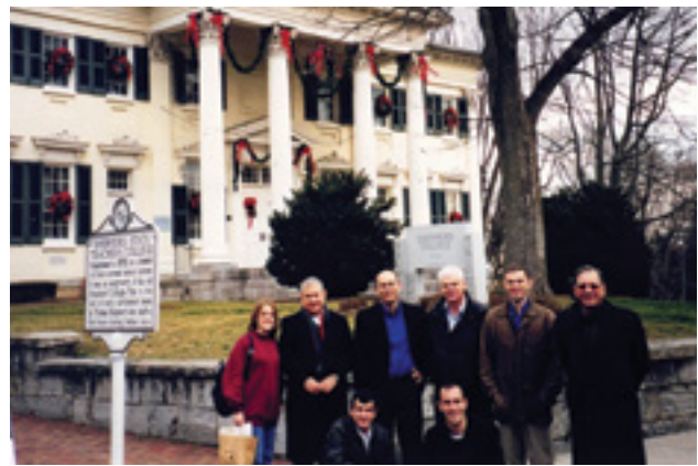
דיוני המשא ומתן עם סוריה בפרסדסטאון, ארה"ב

"זה נכון שהייצוג אינו שווה, אם כי יש הרבה חוקרות במכון, כולל בקרב החוקרים הבכירים, וקולן של הנשים נשמע היטב. יש שיפור רב לעומת המצב שהיה כשהגעתי לפני עשר שנים. עדיין הייתי רוצה לראות עוד נשים בתפקידי מפתח ובמחקר בתחומי הביטחון הלאומי. הפער מתחיל בחסמים שיש בצה"ל לקידום נשים לתפקידים הבכירים, שאחד מהם הוא חסימת מרבית תפקידי הלחימה בפניהן, וכן הטיות נגד נשים והאתגר של שילוב השירות עם חיי משפחה. הדרך לשוויון עדיין רחוקה. כאשר גניע לשוויון בשלבים הראשונים ובמסלולי הקידום במערכת הביטחון - יוכלו נשים לצמוח למוקדי קבלת ההחלטות וגם נראה יותר נשים מומחיות בעלות ניסיון מעשי בתחומי הביטחון הלאומי".