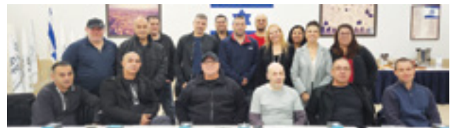
סדנת העצמה מחוז צפון