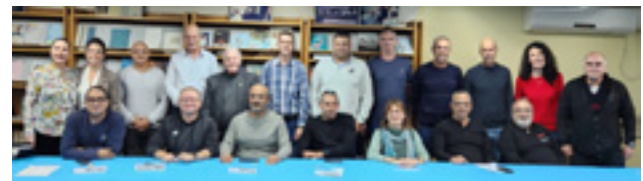
סדנת העצמה מחוזות דן ושרון