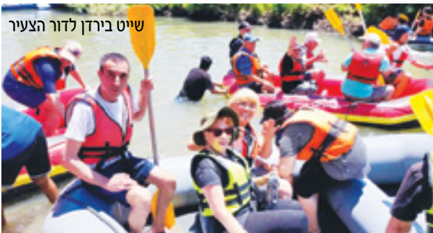
שייט בירדן לדור הצעיר