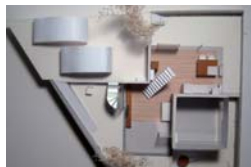
小松一平 《あやめ池の家》2013