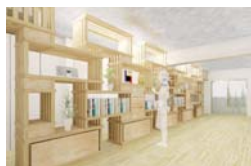
塚越智之 《小径間伐材を利用した集合住宅の改修計画》2013-

Under 30 Architects exhibition 30歳以下の若手建築家による建築の展覧会