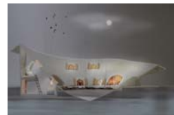
杉山 幸一郎 《凹んだ屋根の家》2013