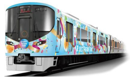
※画像はイメージです ※他の車両で運転する場合があります