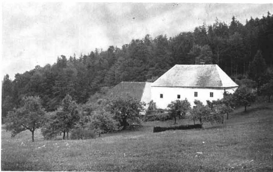
Bild 3: Das „Hochhaus“ bei Schlägl. Der Altbau ist an den kleineren Fenstern gut zu erkennen