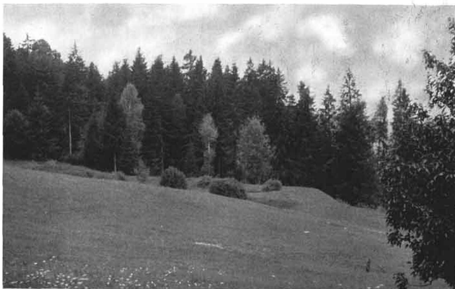
Bild 2: Die Teiche. Am linken Bildrand die Böschung der Vogeltenne